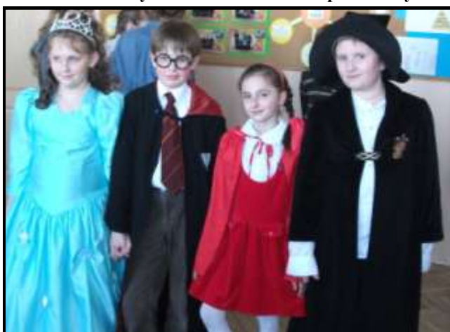
Księżniczka, Potter ...czyli choinka szkolna