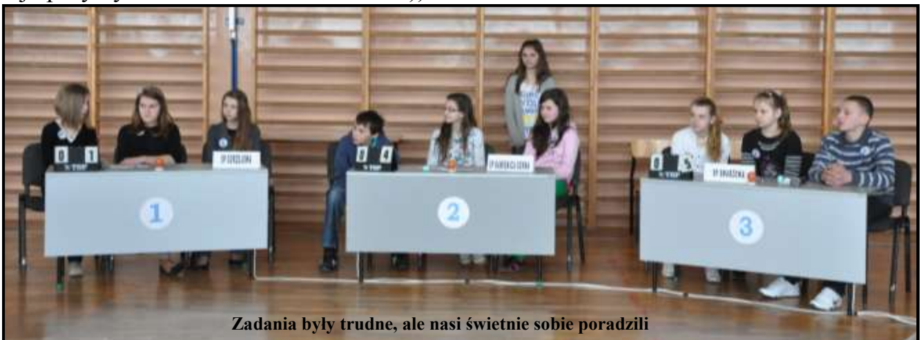
Zadania były trudne, ale nasi świetnie sobie poradzili

Po konkursie poszliśmy zapoznać się z naszym przyszłym gimnazjum. Wszystko nam się bardzo podobało i niektórzy już nie mogą się doczekać kiedy pójdą do gimnazjum. A najlepszy był obiadek. Mniam mniam :-)).