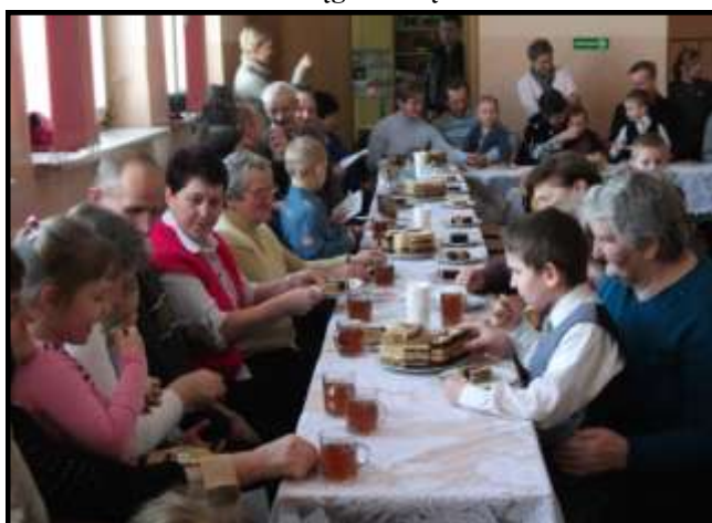
Dzień babci i dziadka