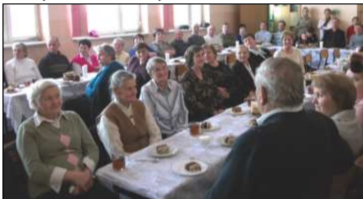
Nasze kochane babcie i dziadkowie podczas poczęstunku.

Jestem jeszcze mały mam malutkie nóżki, rączki i uszka, ale za to me życzenia płyną wprost z serduszka. Nie namaluje jeszcze laurki, nie przyniosę kwiatka, ale bardzo kocham swego dziadka! Jestem jeszcze mały, ale gdy urosnę już przyniosę Ci dziadku cały bukiet róż. Uścisknę Cię mocno i nie wypuszczę już!