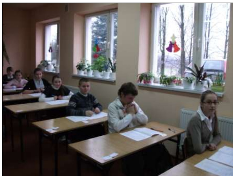
Klasa VI podczas próbnego testu kompetencji.

12 stycznia 2012 roku wszystkie klasy VI w całej Polsce pisały próbny Test Kompetencji. Uczniowie na pewno bardzo się stresowali, ale wyniki testu były pozytywne. 3 kwietnia przyszło nam pisać właściwy test kompetencji. Mam nadzieję że wszystkim poszło bardzo dobrze. Za wszystkich trzymam mocno kciuki i z niecierpliwością czekam na wyniki.